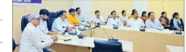
भिवानी। वीडियो कांफ्रेंस में उपस्थित उपायुक्त व अन्य अधिकारी।