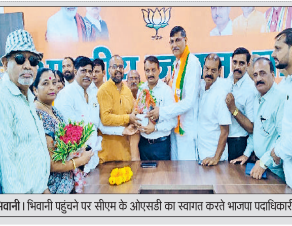
भिवानी। भिवानी पहुंचने पर सीएम के ओएसडी का स्वागत करते भाजपा पदाधिकारी।