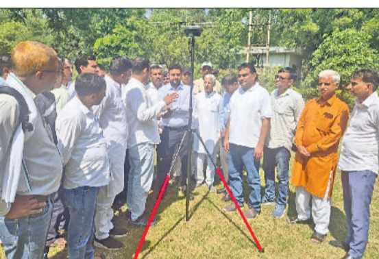
तोशाम। रोवर मशीन के बारे में जानकारी देते हुए।