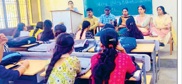
भिवानी। कार्यक्रम को संबोधित करती वक्ता।