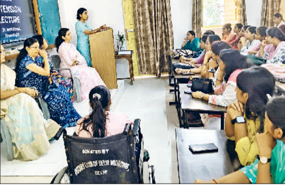
भिवानी। वैश्य कोलेज में अनियमित मासिक धर्म को विषय में बताती वक्ता।

महिला सेल का उद्देश्य लड़कियों के ज्ञानवर्धन के लिए सकारात्मक कार्यक्रम करवाना है