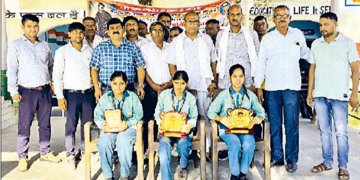
भिवानी। विजेता छात्राओं को पुरस्कृत करते अतिथि व शिक्षक।