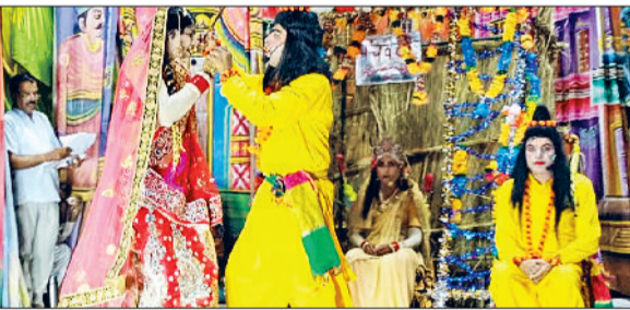
लोहारू। रामलीला का मंचन करते कलाकार।

रामलीला मंचन में पिता के वचनों की लाज रखते हुए 14 वर्ष के वनवास पर वनों में भटकते हुए राम, लक्ष्मण और सीता की छठे दिन सुर्पणखा मुलाकात होती है। अपने सौंदर्य पर इटालने वाली शूर्पणखा की हरकतों से नाराज होकर लक्ष्मण ने सुर्पणखा की नाक काट दी और बाद में सुर्पणखा की नाक का बदला लेने पहुंचे खर और दूषण का श्रीराम व लक्ष्मण के साथ युद्ध में वध हो जाता है। छह दिनों से चल रहे रामलीला मंचन को लेकर शहर के लोगों में काफी उत्साह देखने को मिल