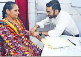
भिवानी। शिविर में मरीज की जांच करते चिकित्सक।